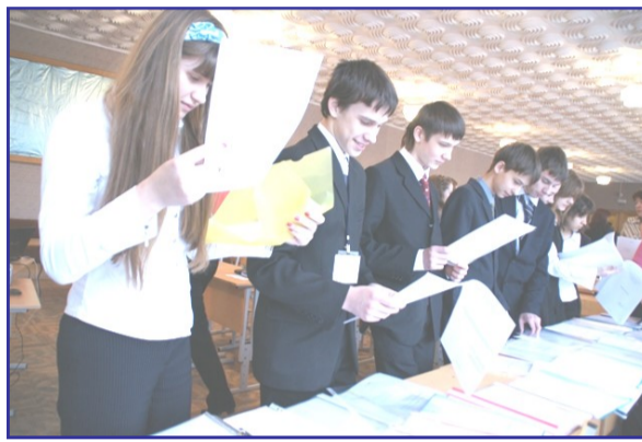
Участники XV научно-творческой конференции «Эпоха. Общество. Человек.»

2.Медико-технический лицей – 21 победитель 3.Гимназия 1 – 17 победителей 4.Дневной пансион 84 – 15 победителей 5.Гимназия «Перспектива» - 13 победителей 6.Гимназия 11 – 13 победителей 7.Лицей авиационного профиля 135 – 9 победителей 8.Лицей «Технический» – 8 победителей 9.Школа 6 – 8 победителей 10. Лицей 124 – 8 победителей Конечно, такие результаты не могут не радовать, но они же и ко многому обязывают. Как известно, завоевать победу порой бывает легче, чем удержать ее.