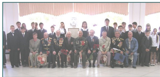
Снимок на память в холле лицейя

Их торжественно встречали ученики лицейя. После Урока мужества ребята по-новому взглянули на ветеранов-танкистов, узнавая в них черты героев из только что увиденного фильма. Они вручали ветеранам цветы, рассматривали их медали.