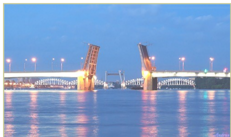
Северная столица—С.Петербург