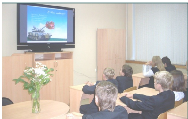
Урок мужества в 7 «Б» классе

Тема подвига воина-танкиста продолжилась на первом уроке, который прошел во всех класса как Урок мужества.