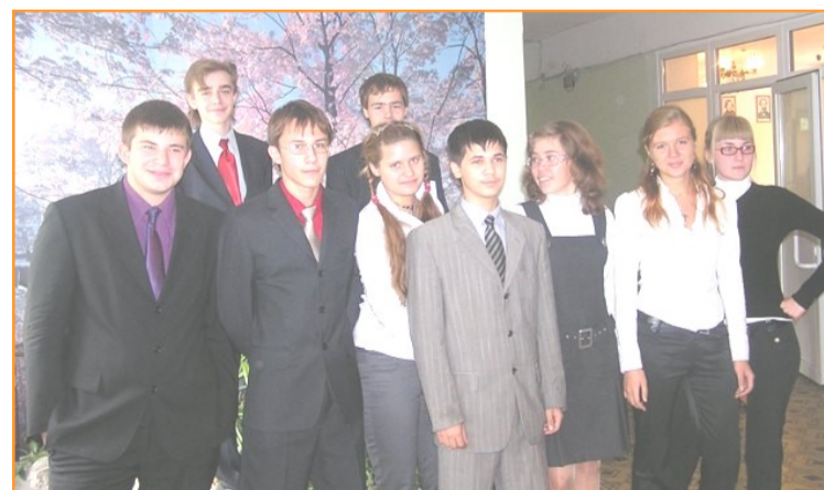
Совет лицея прошлого 2008-2009 учебного года

Внимание! 26 сентября 2009 года в театральном зале лицея пройдет отчетно-выборная конференция ученического Совета лицея . Приглашаются активы 8-11 классов.