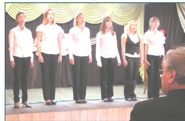
Ветеранов приветствует ансамбль «Романтика»