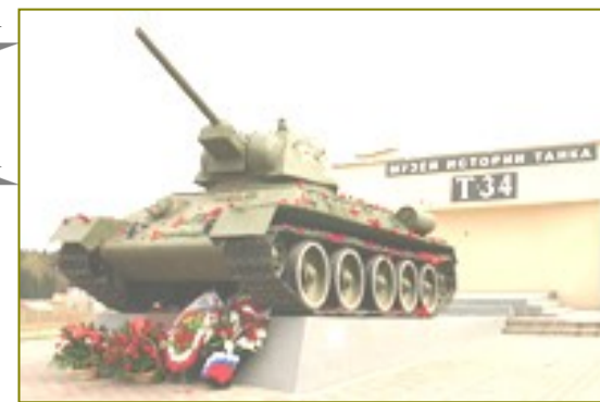
Памятник и музей знаменитому танку Т-34 на окраине дер.Шолохово (Московская обл.)

Для ветеранов состоялся концерт, который открыл хор учащихся