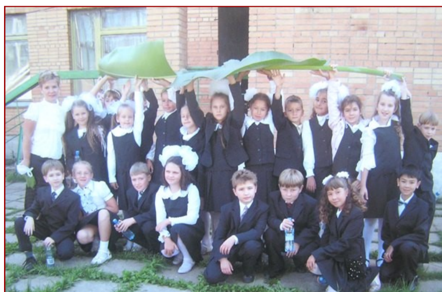
Во время экскурсии на станцию юннатов.

А еще проникнуться экзотикой смогли все участники экскурсии, когда работники станции юннатов подарили лист банановой пальмы. Размеры его таковы, что под ним легко спрятался целый класс. Не верите?! Взгляните на снимок справа.