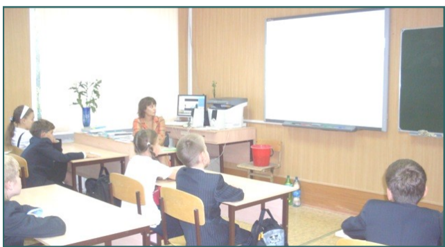
Урок мужества в 5 «Б» классе

Одним из запоминающихся его моментов был просмотр танкового сражения на Курской дуге из фильма «Освобождение».