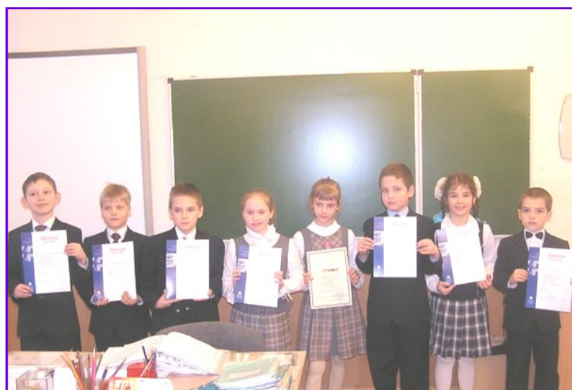
Победители одной из секции прошлогодней конференции «Первые шаги в науку»

Такой серьезный подход к делу должен обязательно обернуться успехом на конференции. Его-то мы всем ребятам и желаем!