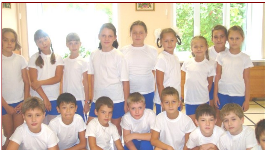
На старт выходит сборная 3 "Б" класса

ПОСМОТРИТЕ-КА НА НАС, МЫ-СПОРТИВНЫЙ СУПЕР-КЛАСС!