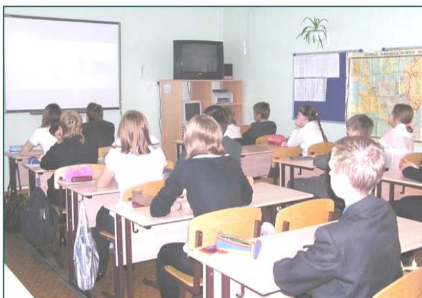
Урок мужества в 8 «Б» классе: ребята смотрят фрагмент фильма «Освобождение»

Многих учеников впечатлил героизм совсем молодых танкистов, бесстрашно идущих в атаку на врага в то время, как самим зрителям от вида надвигающегося противника хотелось сжаться и спрятаться.