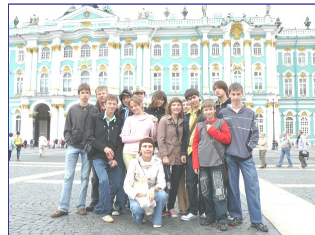
На Дворцовой площади

Двумя самыми яркими впечатлениями от Питера были развод мостов и путешествие на катере по каналам. Развод мостов - грандиозная вещь, без неё немислим Петербург. Во время путешествия на катере по каналам взору открывается неповторимая картина европейского города XVIII века. Мы видели и мост, под которым пролетел Чкалов, и последнюю квартиру Пушкина, в которой он скончался после дуэли с Дантесом, и Чижика-Пыжика и много других удивительных мест.