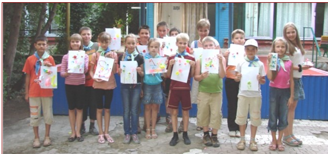
На фото: команда «Лука-Морье» участвует в одном из мероприятий Турнира «Эврика»

Нам, волжанам, было интересно познакомиться с жизнью и бы-