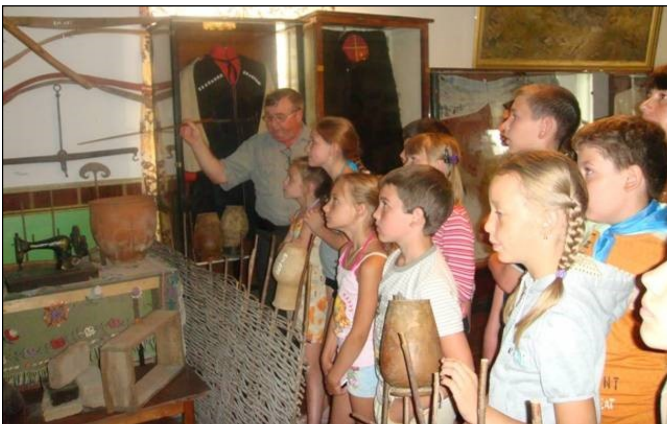
На фото: экскурсия по музею станицы Бриньковской. Экспозиции музея охватывают период с момента появления на месте станицы первого поселения (3 тысячи лет назад) до наших времен

С легкой грустью команда «Лука-Морье» участвовала в закрытии лагерной смены, ведь предстояло расставание с ребятами, с которыми мы успели подружиться, с этим гостеприимным краем. Приятным сюрпризом стал приезд бардов, с которыми пели любимые песни. Расставаться с друзьями, морем, богатой природой Краснодарского края не хотелось! Но Турнир завершил свою работу. Мы отдохнули, омолодились, одержали важные победы. И, бросая в море монетку,