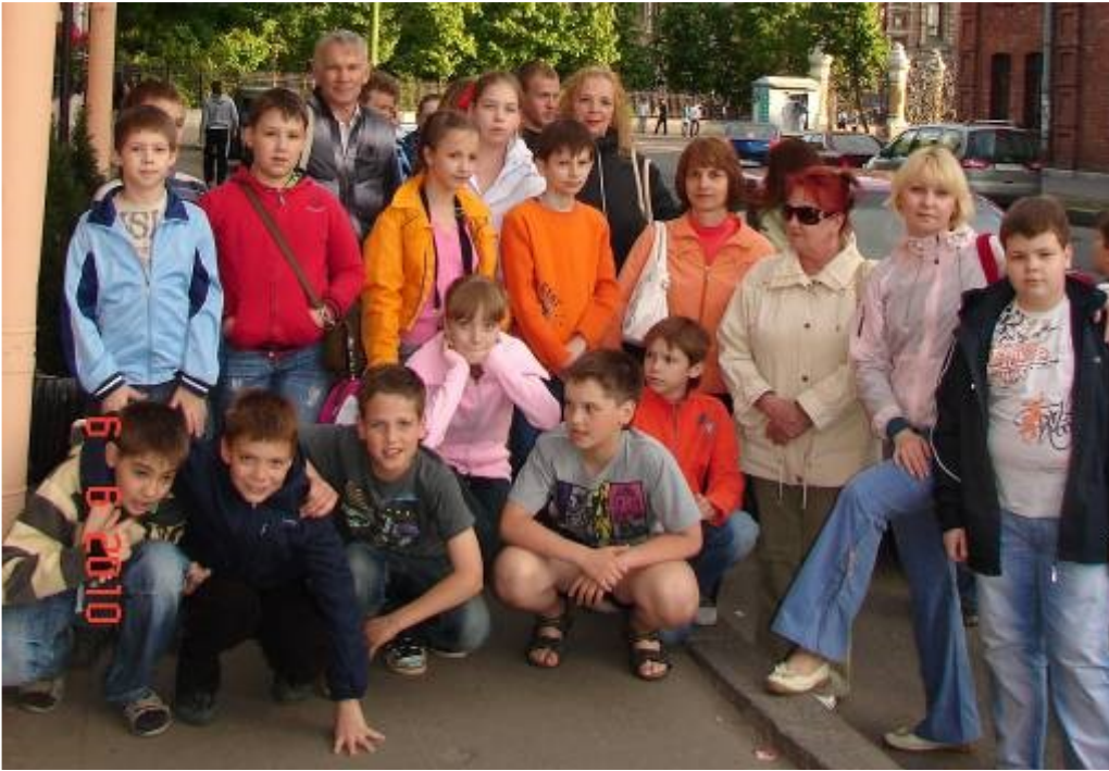
наш дружный коллектив детей и взрослых в С.Петербурге