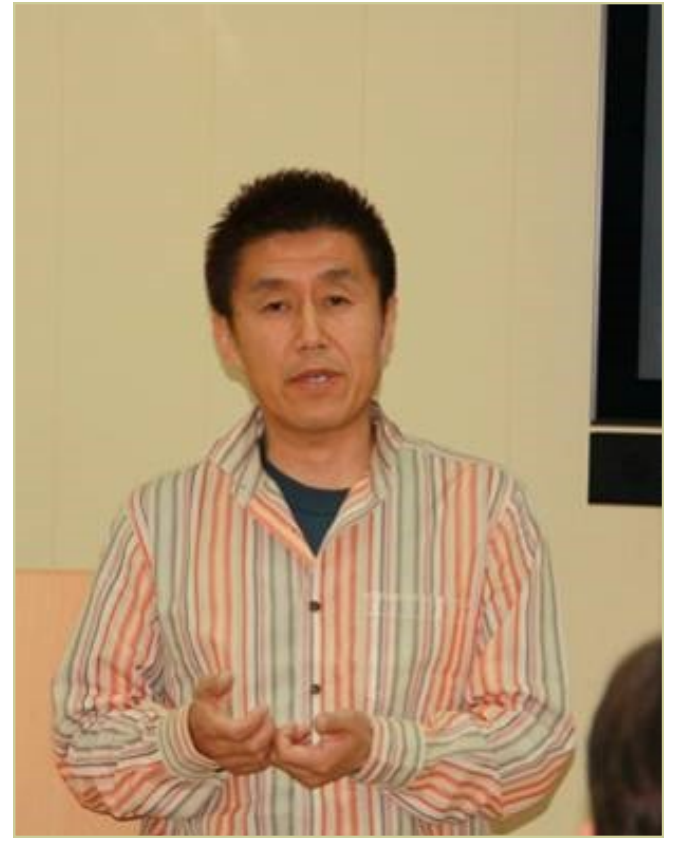
На фото: момент встречи старшеклассников СамЛИТа с японскими учеными. Неподдельный интерес к теме лекции и друг к другу!

Такаши Матсуока и Сатоши Ирияма прочитали лекцию про информационную теорию и создание квантовых компьютеров. Слушателями были учителя и ученики старших классов. Информация, изложенная японскими гостями, была очень содержательна и вызвала большой интерес у всей аудитории.