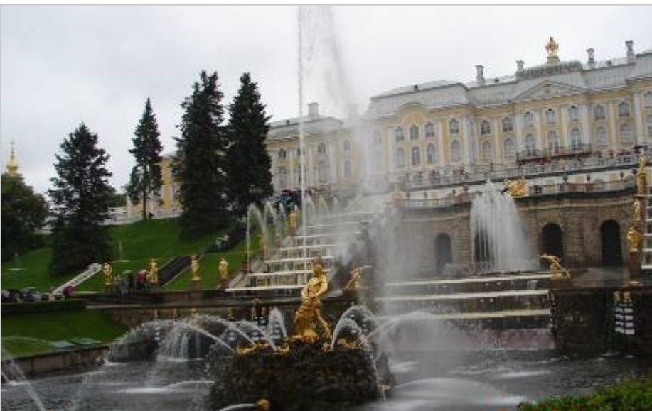
знаменитые фонтаны Петергофа. Фонтан Самсон

Подозреваю, что значительная часть наших лицеистов там уже побывала, может и не раз, и ничего нового для себя в моем повествовании они не узнают. А вот я и мои одноклассники ехали в С.-Петербург впервые, до этого - много слышали о нем, о музеях и памятниках, парках и дворцах, о том, что город был основан Петром Первым, воспет многими поэтами и художниками. Теперь вы понима-