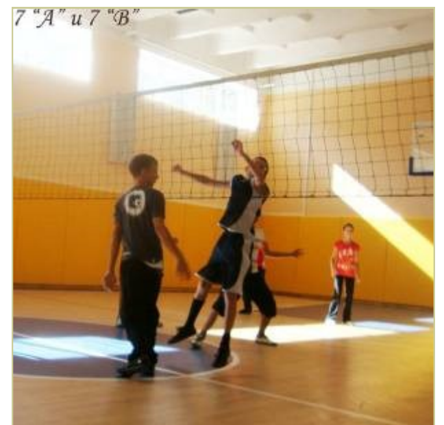
На фото: соревнуются команды 7 «А» и 7 «В»

Но это ещё не окончание игры. Борьба за второе место! Третья игра и второе место за 7 «В» классом. Yes! Третье место у 7 «Б»! Оле-оле-олеeee!